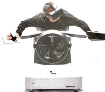
Les Zurichois de Birdly ont séduit le monde avec leur simulateur de vol d'oiseau.

«Les résultats présentés par Ozwe dans le monde de la VR montrent que, dans cette industrie croissante, la Suisse peut se faire une place de leader technologique. Les ingrédients sont tous présents, il «suffit» de les réunir, les catalyser. Le jeu Anshar Wars 2 , production la plus aboutie pour les casques GearVR, prouve que c'est réalisable en s'y prenant à