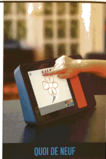
QUOI DE NEUF

Dans le même temps, de nombreux ateliers et espaces de démonstration permettront aux visiteurs de découvrir les 1001 facettes et applications de la réalité virtuelle. Grâce à des casques, mais aussi des décors, accessoires et parfums pour plonger le public dans une réalité toujours virtuelle, mais avec des sensations bien réelles. ■